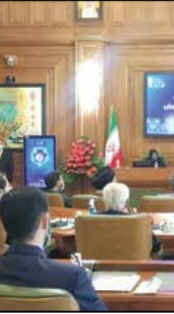
این عضو شورای شهر تهران با اشاره به مواردی که