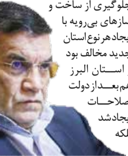
این عضو سابق شورای شهر تهران گفت: به هر میزانی که واحدهای تقسیمات کشوری متعدد و متنوع باشند زمینه بیشتری برای سوءاستفاده این سوداگران فراهم می‌شود به این منظور در دولت اصلاحات شورای عالی شهرسازی و معماری نه تنها با هدف صیانت از سرزمین استان تهران و جلوگیری از ساخت و سازهای بی‌رویه با ایجاد هر نوع استان جدید مخالف بود و استان البرز هم بعد از دولت اصلاحات ایجاد شد بلکه

و به نظر من رسیدن که دولت و مسئولان با توجه به بالا بودن حجم نارضایتی در آستانه انتخابات ۱۴۰۴ ریاست جمهوری و چون عملا دستاورد قابل عرضه‌ای ندارند و وعده‌ها در خصوص حل مشکلات معیشتی و مسکن و مسئله ارز و... نتیجه عکس داده است؛ به دنبال دستاوردسازی‌های سیاسی هستند