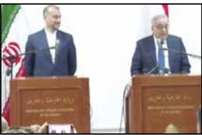
ارشاد کشورمان، تأکید کرد: معتقدیم برای حل مشکلات موجود، می‌بایست فرمت آستانه با مشارکت دادن سور به تقویت شود.

مدیر کل اژانس بین‌المللی انرژی گفت که مذاکرات هسته‌ای با ایران به «بن بست» رسیده است. به گزارش ایلنا، «افائل گروسی» افزود: نه در مذاکرات اژانس و ایران، نه در مذاکرات احیای برجام پیشرفتی حاصل نشده است. گروسی که با پایگاه خبری رسمی واتیکان گفت‌وگو می‌کرد، با اشاره به مذاکرات هسته‌ای با تهران گفت: «یک بن بست وجود دارد، مذاکرات متوقف شد و بی نتیجه ماند، جلسات و تبادلات زیادی وجود دارد و به همین دلیل است که اژانس - من شخصاً - نمی‌خواهم این خلاسیایی در اطراف چنین مساله مترزل و خطرناکی باقی بماند». وی با ابراز نگرانی از افزایش حجم و میزان غنی‌سازی اورانیوم و توسعه و ساخت سانتریفیوژهای پیشرفته‌تر و بیشتر، مدعی شد که این اقدام‌ها گام‌هایی در راستای گسترش سلاح هسته‌ای است که باید از آن اجتناب شود. گروسی همچنین خواستار سفر به ایران و از سرگیری مذاکرات با مقام‌های این کشور شد.