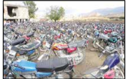
گفت و گو

رئیس پیشین انجمن موتورسیکلت ایران گفت: کل مصرف واقعی ارز موتورسیکلت ۱۵۰ تا ۲۰۰ میلیون دلار است در حالی