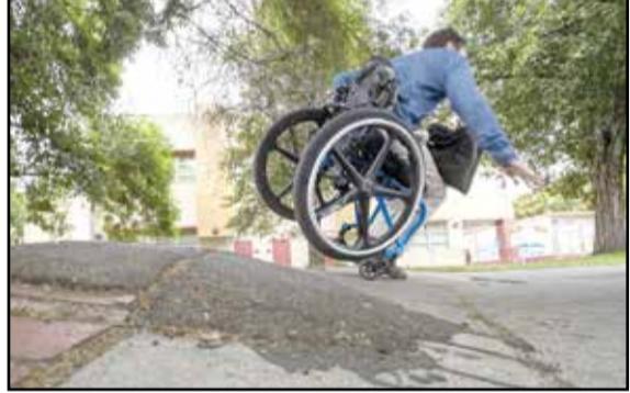
مثبت در افراد معلول و فرهنگ سازی و تغییر نگرش عمومی نسبت به گردشگری از اهداف این مؤسسه است.

محلی حاشیه جنگل‌های شمال شود. مطرح مدیریت پایدار را برای تمام ۱۰۴ حوضه آبخیز مربوط به جنگل‌های هیرکانی تدوین کرده‌ایم و در آن، صرفه مسائل مربوط به منابع طبیعی و جنگلداری توجه نکرده‌ایم، بلکه تمام مسائل اقتصادی، اجتماعی و فرهنگی مربوط به عرصه‌های جنگلی شمال نیز مدنظر قرار گرفته است. برخورداری طرح مدیریت پایدار جنگل‌های هیرکانی از ۷۵ لایه مطالعاتی نوبخت با بیان این که طرح مدیریت پایدار جنگل‌های هیرکانی از ۷۵ لایه مطالعاتی برخوردار است، عنوان کرد: در سال گذشته