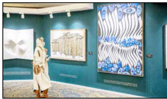
آغداشلو و حواشی اخیر

اگر چه شماری از هنر جوینان و روزنامه‌نگاران و... مدعی شدند که توسط وی مورد آزار جنسی قرار گرفته‌اند اما نکته اینجا بود که هیچ اقدامی مبنی بر ثبت شکایت رسمی از وی صورت نگرفت و توقع هم نمی‌رفت که دادگاه با توجه به اظهارات در فضای مجازی، فردی را مورد محاکمه قرار بدهد. اما این رکورد ۱۲ میلیاردی آغداشلو به بیان بسیاری از هنرمندان، نوعی دهن کجی از سوی حراج و برخی